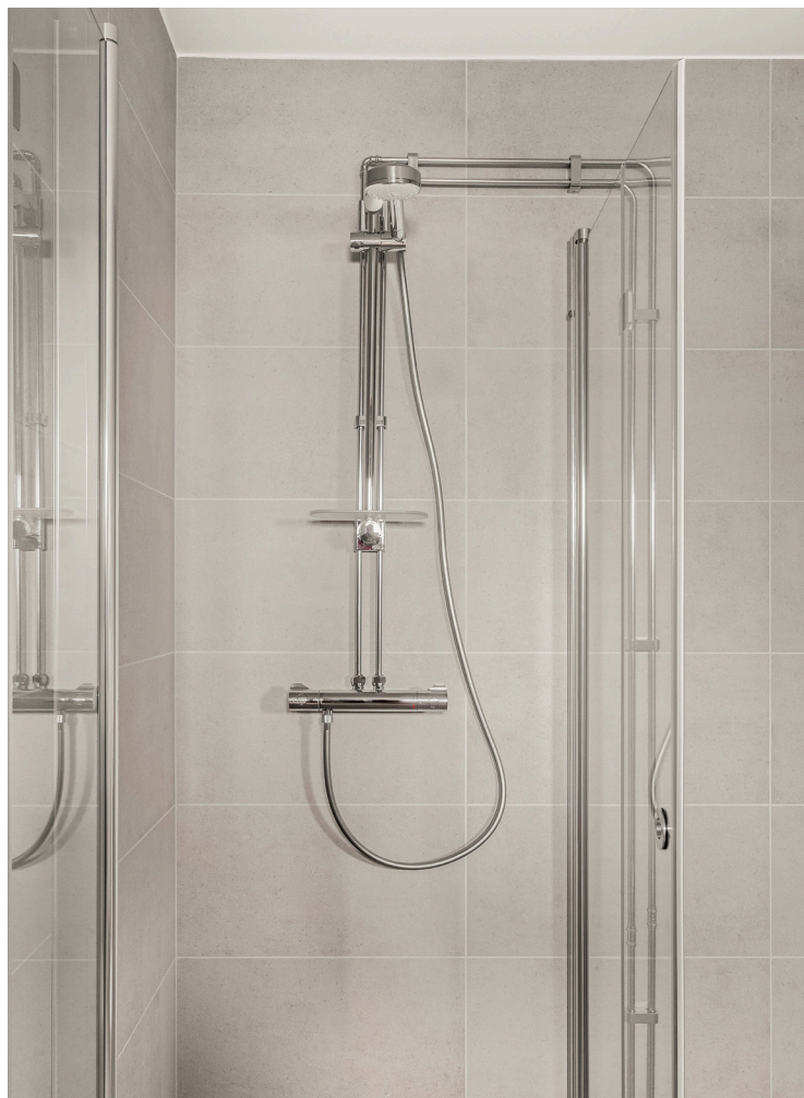
Rymlig duschkörna med glasdörrar.