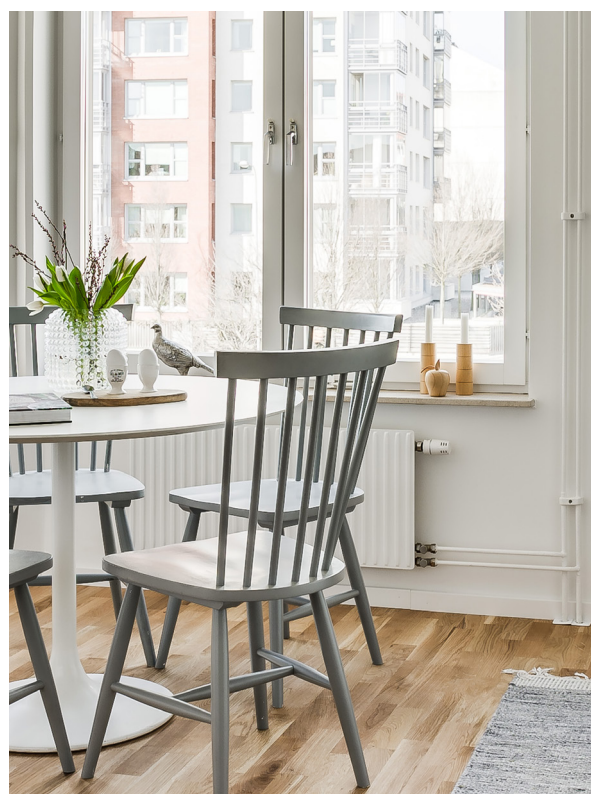
Ekparketten ger köket en varm och ombonad känsla.

Ett rejält kök helt enkelt där du kan tillaga härliga middagar både till vardag och fest!