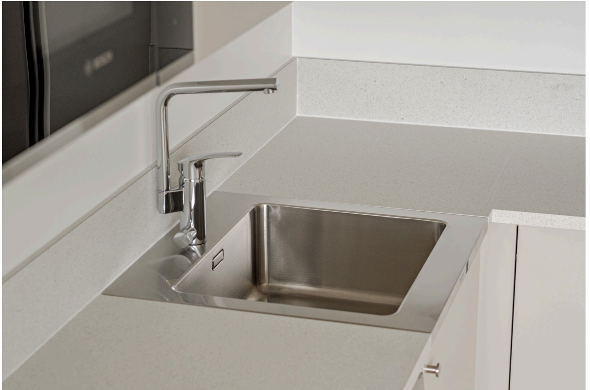
Lättskötta arbetsytor och vattenbesparande blandare.