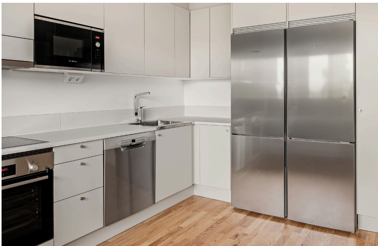
Vitvaror från Bosch i tidlöst rostfritt stål.