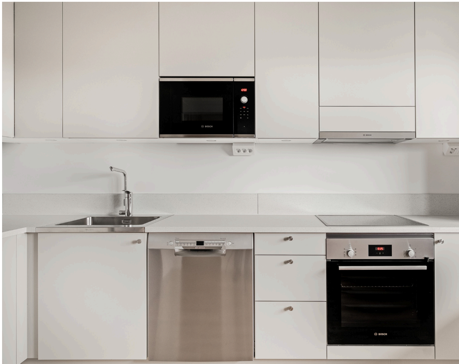
Ett praktiskt och elegant kök i en varm beige ton.