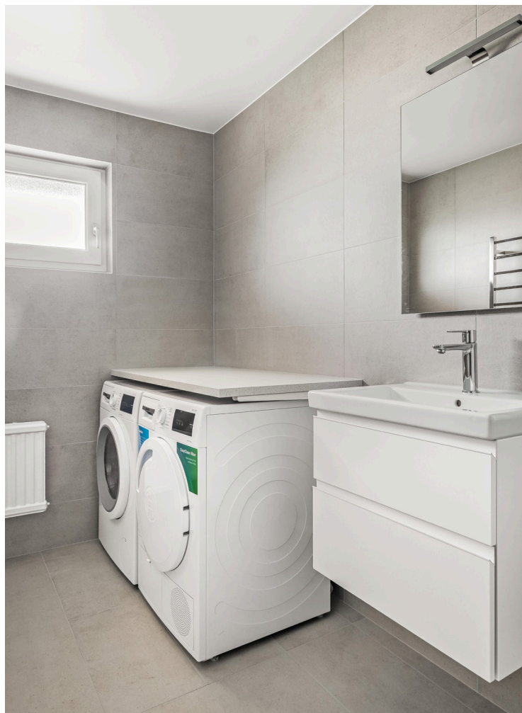
Många av lägenheterna är försedda med vitvaror för tvätt.

Badrummet har skön golvvärme och är försett med duschkörna med glasväggar, vattenbesparande blandare samt en rymlig kommod med eluttag. Många lägenheter är även utrustade med tvättmaskin, torktumlare och handdukstork.