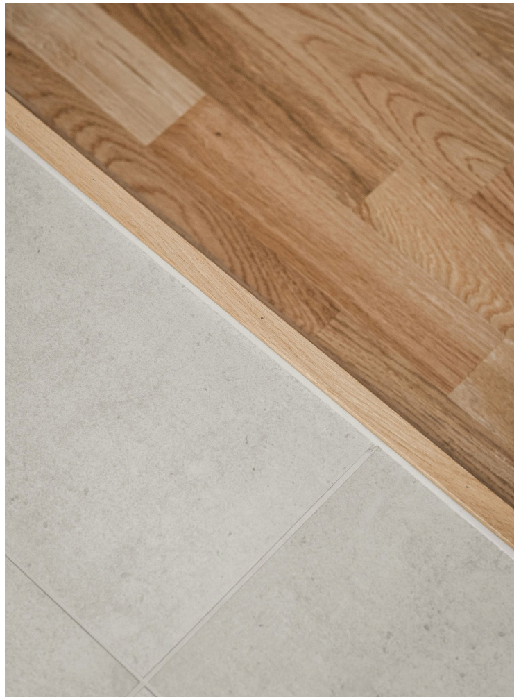
I hallen möts man av ett praktiskt klinkersgolv som gifter sig fint med ekparketten.